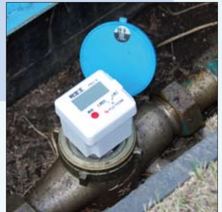
給水メーターに設置・測定