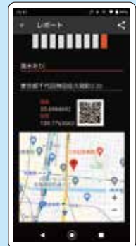
位置情報付きレポート