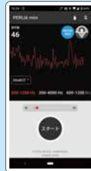
音聴中もレベル確認