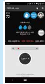
簡易自動漏水判定

ピックアップセンサーの面で音をキャッチするので、宅地内だけでなく公道での漏水調査にも適しています。